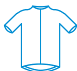
Le maillot cycliste du défi des Cistes