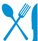
Repas + petit-déjeuners