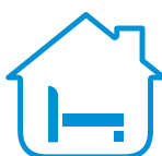
Hébergements (3 nuits)